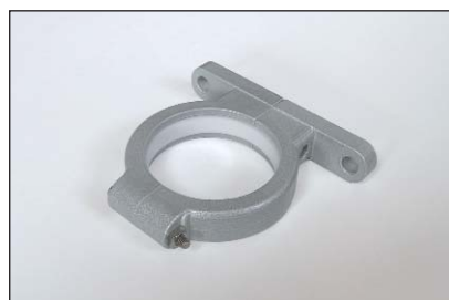
Support de fixation mural