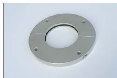
Traversée de toit