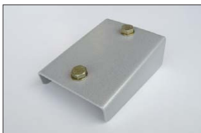
Equerre de fixation inférieure