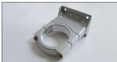
obere Befestigung mit Lager